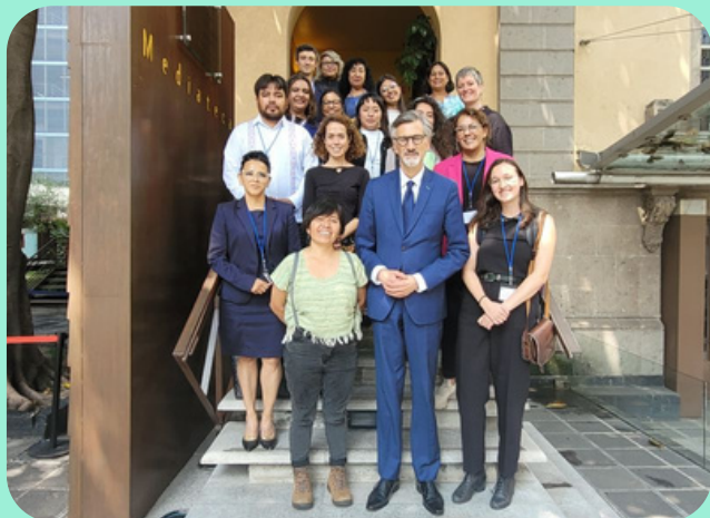
Las OSC seleccionadas por el FON en México con el Embajador de Francia