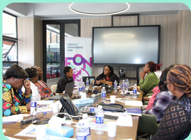
Reunión de lanzamiento entre OSC de Kenia y el equipo de FON