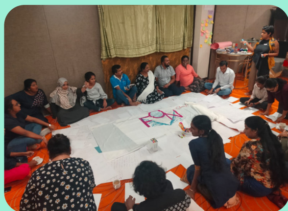
OSC de Sri Lanka seleccionadas por FON

Esperamos ser testigos del impacto transformador de estos enfoques feministas a medida que las y los participantes los apliquen en sus actividades de promoción y diseño de proyectos.