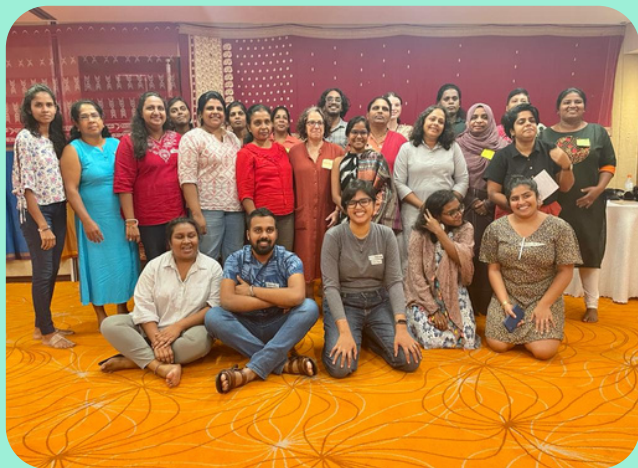
Organizaciones de Sri Lanka que participaron en el programa