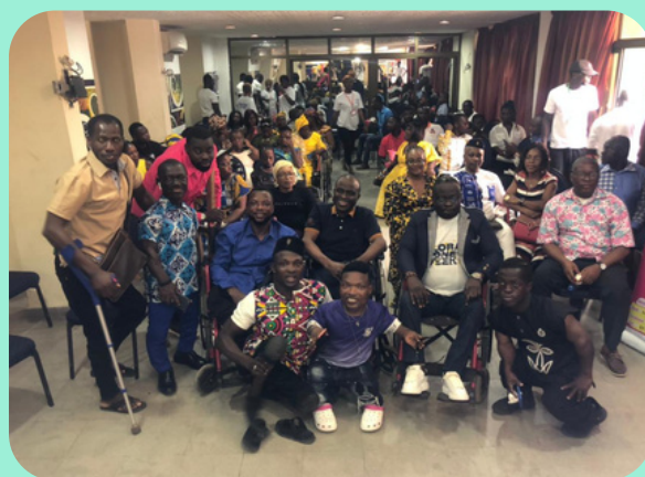
Action et Humanisme, Costa de Marfil

Financiado por FON, este proyecto atiende a 32 personas con discapacidad: 29 mujeres y 3 hombres en la primera fase. Participaron en un taller de formación sobre capacitación económica el 9 de enero de 2024, en la Casa de los Jóvenes de Yopougon.