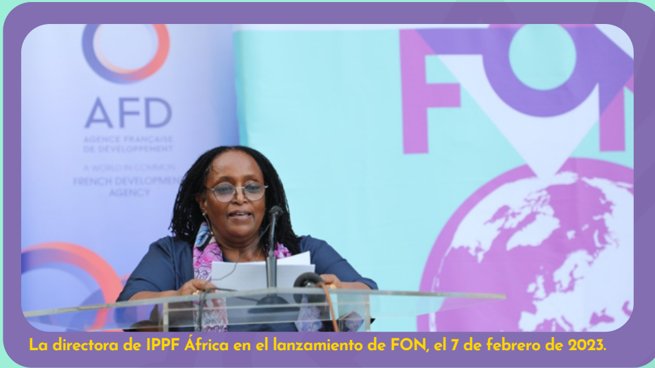
La directora de IPPF África en el lanzamiento de FON, el 7 de febrero de 2023.

Por un mundo libre de violencia de género